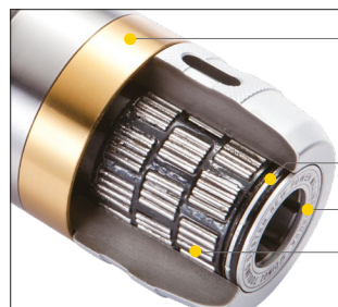
Anello di chiusura