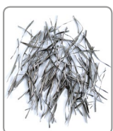
Profondità di taglio= 1,0 mm

La forza di serraggio notevole assicura non solo una grande capacità di lavoro ma anche un effetto antivibrante.