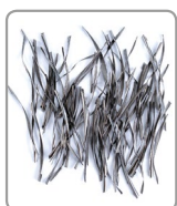
Profondità di taglio= 2,5 mm