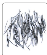
Profondità di taglio= 3,5 mm