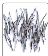
Profondità di taglio= 5,0 mm