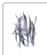
Profondità di taglio= 8,0 mm